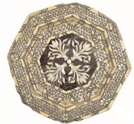
Крышка столика. Дерево, инкрустация. Турция, XVIII в.