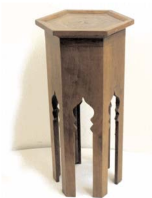
Столик. Дерево, интарсия. Мастер Яков Грозный. Бахчисарай, 1920-е гг. Справа — деталь столика.

В столиках бахчисарайской коллекции использовалась также кость — не только благородная слоновая, мамонтовая и моржовая, но и кость крупного рогатого скота.