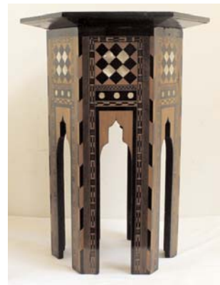
Столик. Дерево, инкрустация. Крым (?), XIX — нач. XX в.

ской культурной традиции, в которой сохранялись древние культы поклонения Солнцу и Луне. Говоря о символике небесных светил, отметим, что в мифологии многих народов звёзды олицетворяют души умерших, поднявшиеся к небу. В орнаментальных мотивах встречается и пятилучевая звезда (пентаграмма), которую можно