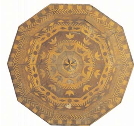
Крышка столика. Дерево, интарсия. Мастер Яков Грозный. Бахчисарай, 1920-е гг.

имеют мистическое значение и нередко совпадают с символами из других культурных традиций. К примеру, гексаграмма, два треугольника, наложенные друг на друга, — один из самых древних и распространённых религиозных символов.