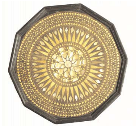
Крышка столика. Дерево, инкрустация. Крым, XVIII в. (?)

трактовать и как символ пяти столпов ислама. Важным элементом орнаментики столиков является колесо. Во многих культурах колесо означает круговорот жизни, а в Средние века колесом изображали годичный цикл.