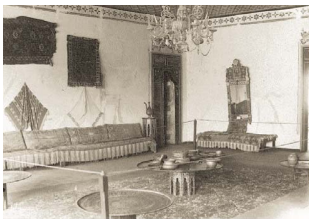
Ханская столовая и посольский зал Ханского дворца. 1920-е гг.

и цветов, виноградную гроздь. Хотя культура виноградной лозы достаточно стара, в исламе отношение к ней двойственное: по легенде, Джебраил (Гавриил), выводя Адама с Евой из райского сада, протянул им в утешение гроздь винограда, но дьявол Иблис напустил на лозу порчу, лишив её благодати.