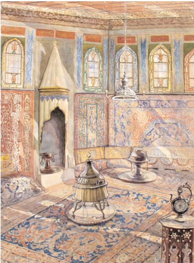
В.К. Яновский. Гарем в Ханском дворце. Аquareль. 1950-е гг.

Некоторые столешницы украшает пальметта — орнамент в виде веерообразного листа пальмового дерева или сложного цветка. В орнаментике одного столика использован гранат, издавна олицетворяю-