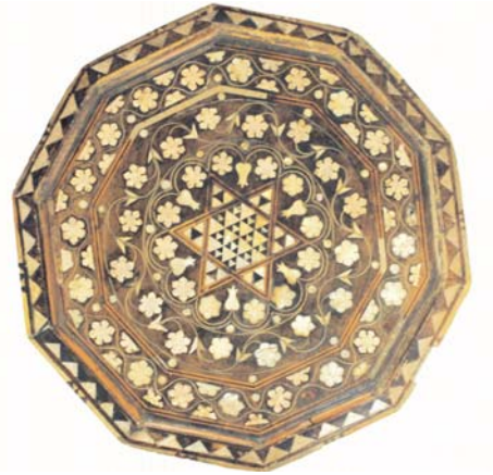
Крышка столика. Дерево, инкрустация. Крым, XVIII в.

щий плодovitость, супружество, любовь. Наряду с экзотическим лотосом встречаются изображения местных цветов — розы, гвоздики.